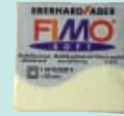
Leucht-Fimo (aus dem Bastelgeschäft) und Silberpapier