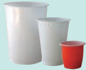
3 verschieden große Plastikbecher (z.B. Buttermilch, Sahnebecher, Kinderjoghurt)