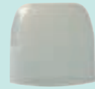
Einen durchsichtigen Plastikdeckel (z.B. von Haarschaumflaschen)